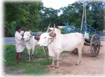
Char à Bœufs