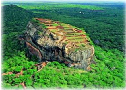
Le Rocher du Lion, Sigiriya