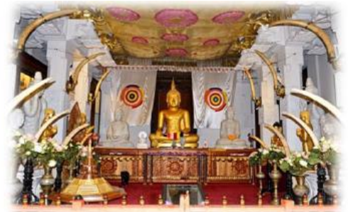
Le temple de la dent