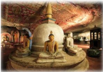
Temple rupestre de Dambulla