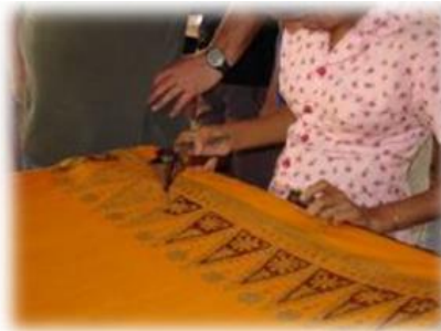
Fabrication du batik