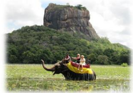
Balade à dos d'éléphants