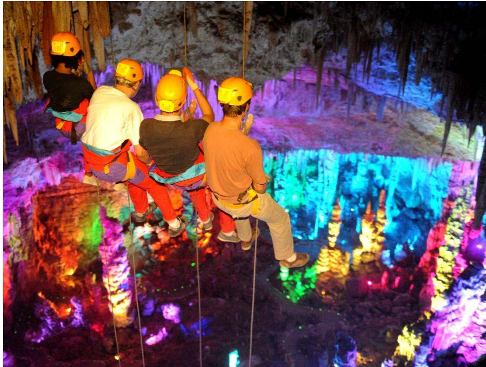
Le Grand Rappel de la Grotte de la Salamandre