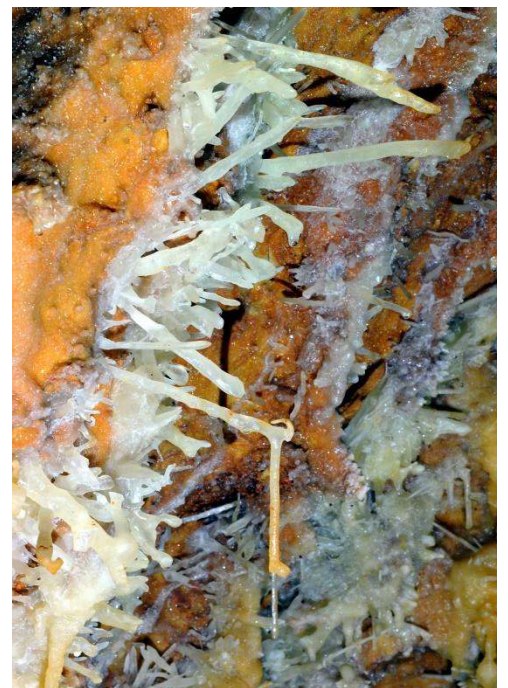
Concrétions « excentriques » dans les galeries

De plus, l'itinéraire choisi permet de découvrir d'autres types de cristallisations que celles visibles dans les parties