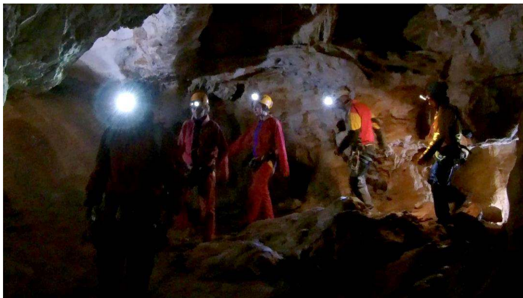
Dans la Grotte Claire

Comme son nom l'indique, la traversée Arva – Grotte Claire est une exploration traversant de l'entrée (l'Arva) vers la sortie (la Grotte Claire). De ce fait, on évite de passer deux fois au même endroit et la course en est d'autant plus agréable.