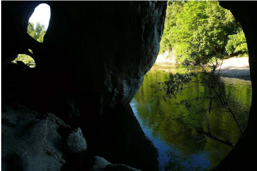
La sortie par le « Trou de la Lune »