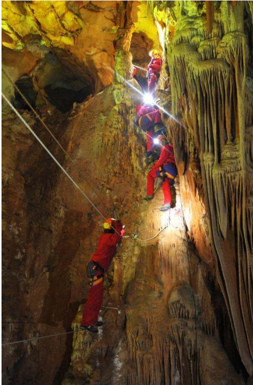
Progression dans les Coulisses de la Salamandre

aménagées. Par exemple, plusieurs « buissons » de rares et fragiles concrétions excentriques peuvent être observés de très près, privilège du spéléologue par rapport au visiteur de grottes aménagées.