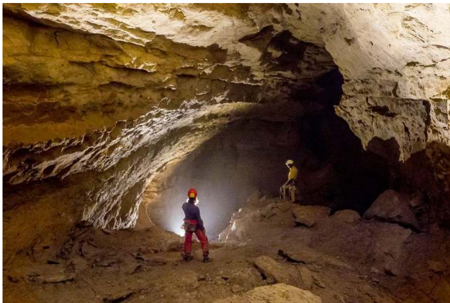
Le « Métro » dans l'Aven du Camelié

L' aven du Camelié est l'un des plus grands réseaux souterrains du Gard. Nous n'en explorerons que la partie la plus accessible au cours d'une belle course néanmoins très complète, qui dépasse la profondeur de -100 mètres, et permettra de passer au cran supérieur.